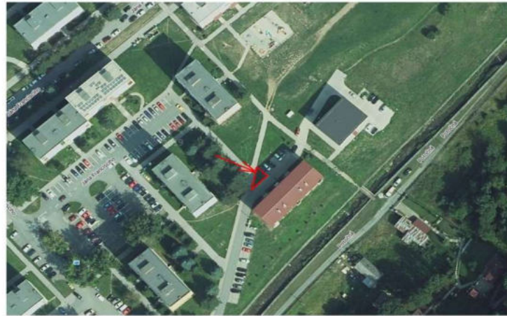
STOJISKO NA SÍDLISKU ZÁPAD