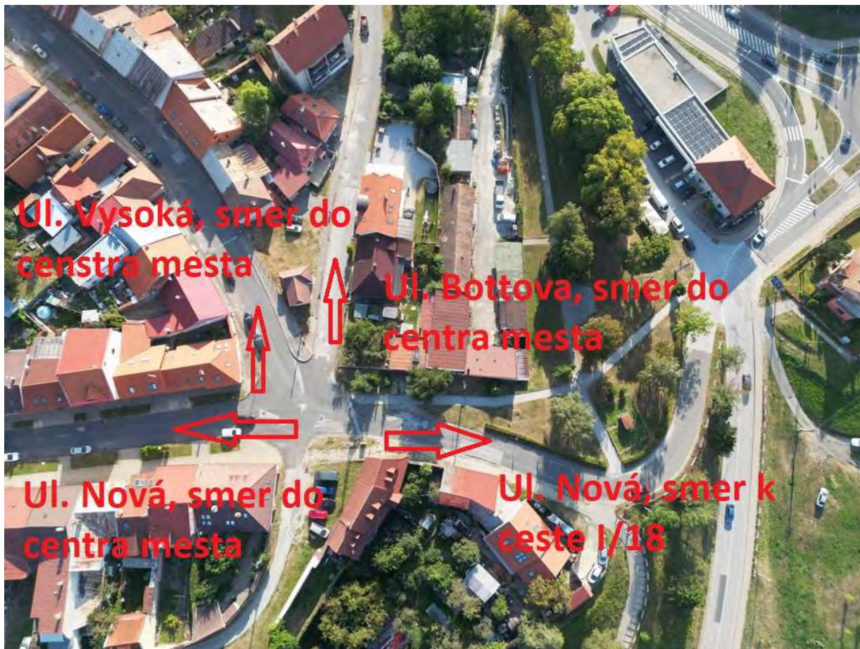
pohľad na poškodené časti cesty – Nová ulica

Projekt: Rekonštrukcia severozápadnej radiály v hradbovom opevnení mesta Levoča Projektový námet IÚI č. # 6557